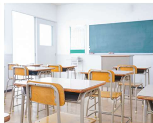
学校・学習塾・幼稚園