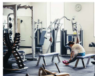
フィットネスジム