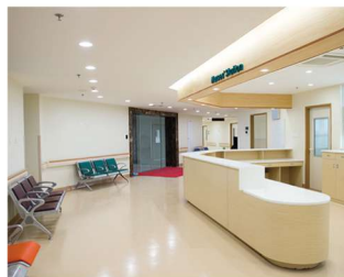
病院・クリニック